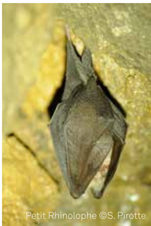
Petit Rhinolophe

En collaboration avec le Life Pays Mosan, le Parc Naturel Burdinale-Mehaigne a mis, cet été, un point d'honneur à étudier les populations de chauves-souris présentes sur le territoire du Parc naturel. Il s'agit de mammifères très sensibles, menacés principalement par la perte de leur habitat et dont les effectifs ont beaucoup diminué au cours des cinquante dernières années.