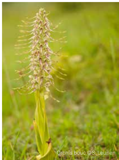
Orchis bouc

L'Orchis bouc ( Himantoglossum hircinum ) et l'Orchis mâle ( Orchis mascula ) sont deux plantes vivaces de la grande famille des Orchidaceae. Loin d'être discrète, l'Orchis bouc peut atteindre 60 cm de hauteur et avoir une inflorescence (ensemble des fleurs) atteignant un quart à un tiers de la longueur totale de la plante.