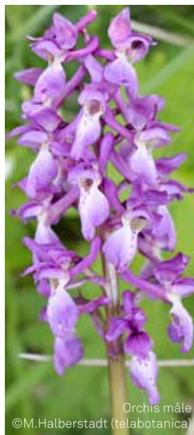
Orchis mâle

La fécondation des fleurs d'orchidées est bien souvent réalisée par les insectes butineurs qui sont attirés par des odeurs, des substances nourricières, ou les leurres